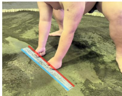
拳が仕切り線の「後線」を超えているが「前線」を超えていない