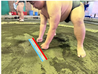
仕切り線の後方に手をついている