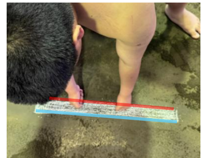
拳が仕切り線の「後線」を超えているが「前線」を超えていない