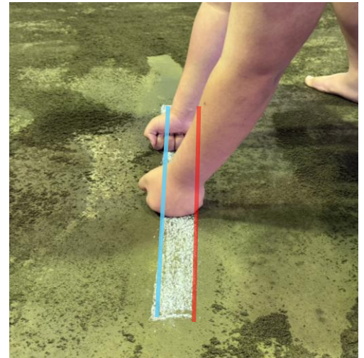
拳が仕切り線の「前線」を超えている